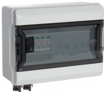
ref 423780 - 1 entrée DC

La présence d'un parafoudre DC permet de protéger l'installation en cas de foudroiement des panneaux PV.