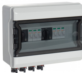
ref 424077 - 2 entrées DC