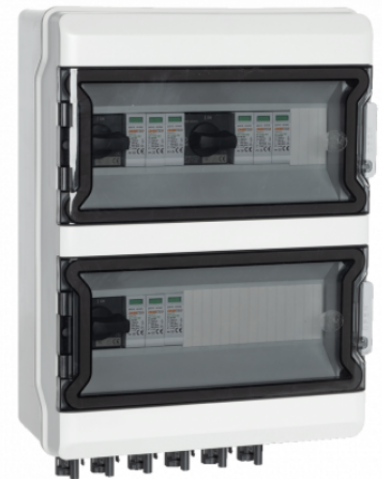
ref 424078 - 3 entrées DC